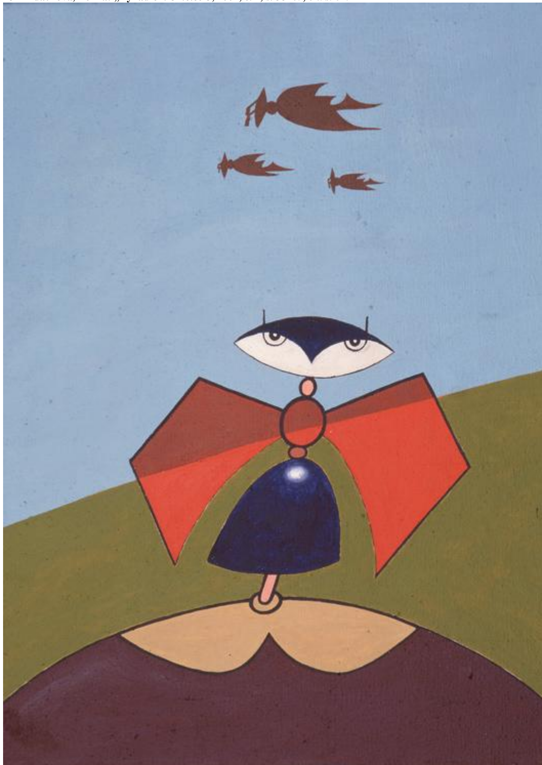
Malby Josefa Ryzce jako „Odlet doteplych krajin“ (1979), 41 x 30 cm, nebo